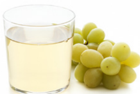
EL ZUMO DE UVA