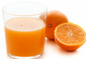
EL ZUMO DE NARANJA