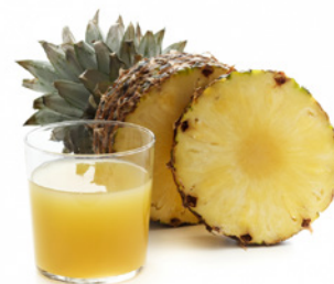
EL ZUMO DE PIÑA