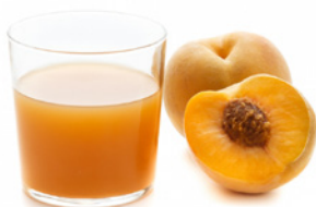
EL ZUMO DE MELOCOTÓN