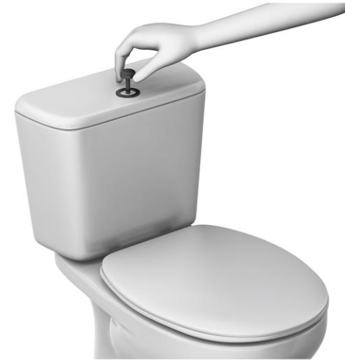
6 TIRAR DE LA CISTERNA