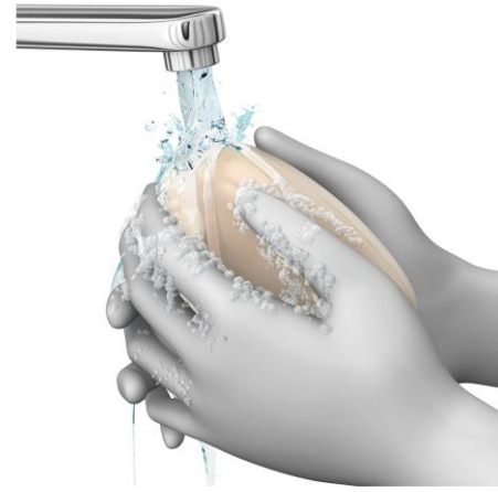
3 FROTAR BIEN LAS MANOS