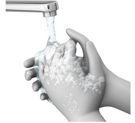
4 ACLARAR EL JABÓN