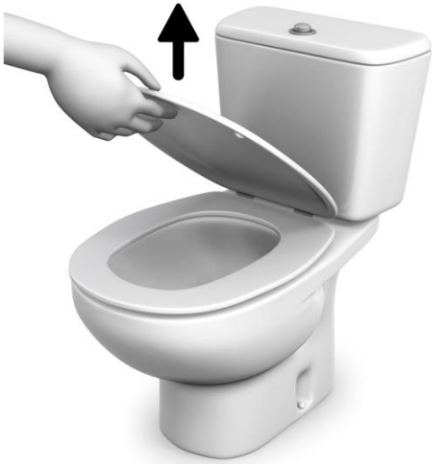
1 SUBIR LA TAPA