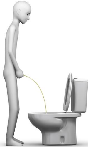
2 HACER PIPÍ O CACA