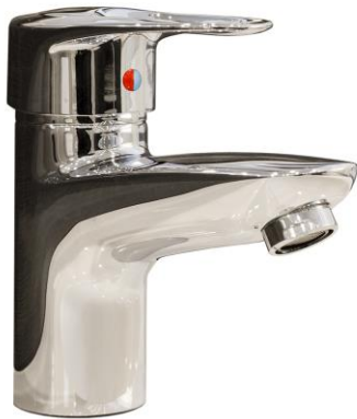
5 CERRAR EL GRIFO