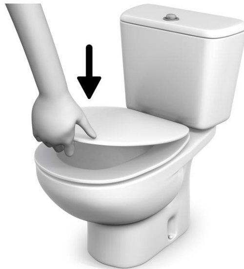
5 BAJAR LA TAPA