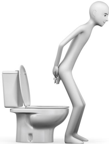
4 LIMPIARSE Y TIRAR EL PAPEL