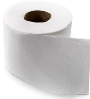
6 SECAR LAS MANOS