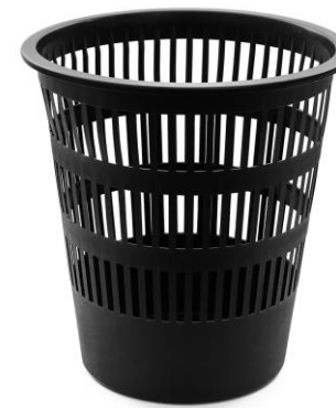
6 TIRAR EL PAPEL A LA PAPELERA