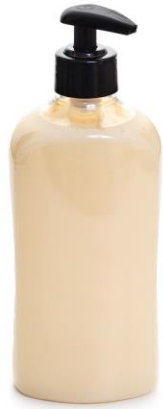
2 ECHARSE JABÓN