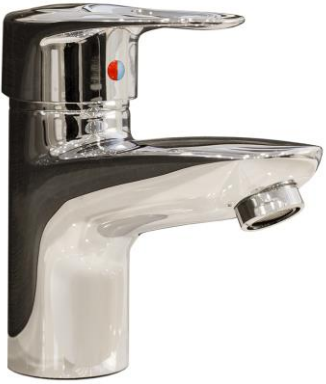
1 ABRIR EL GRIFO