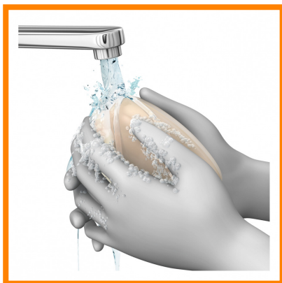
7. Lavarse las manos con jabón