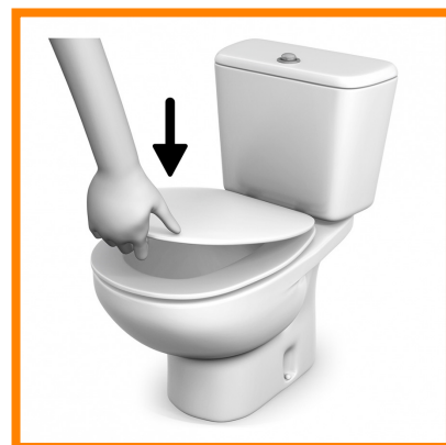
5. Bajar la tapa del váter