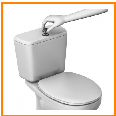
6. Tirar de la cadena