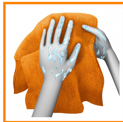
8. Secarse las manos con la toalla