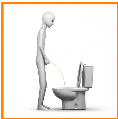
2. Hacer pis o caca