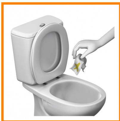
4. Tirar el papel al váter