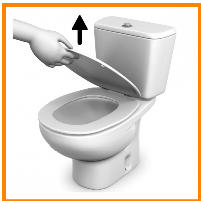
1. Subir la tapa del váter