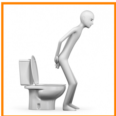
3. Limpirase con papel higiénico