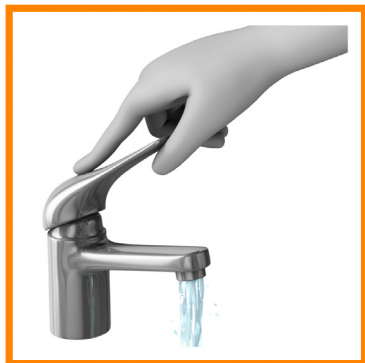
2. ABRO EL GRIFO