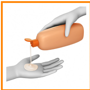
3. ME ECHO JABÓN