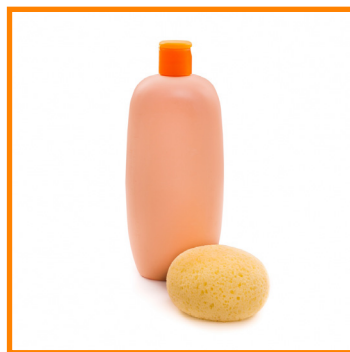
GEL DE BAÑO