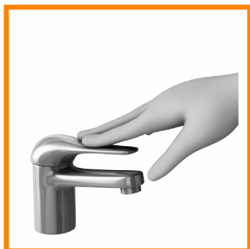
7. CIERRO EL GRIFO