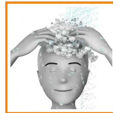
5. ME LAVO EL PELO