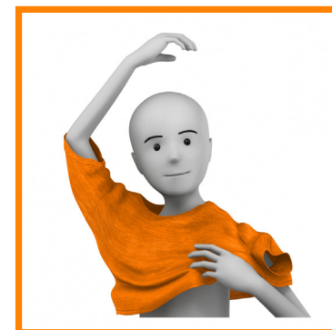
10. ME VISTO