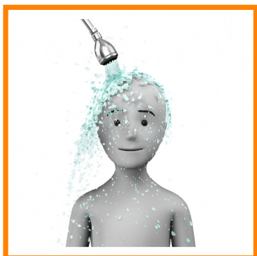
6. ME ACLARO CON AGUA