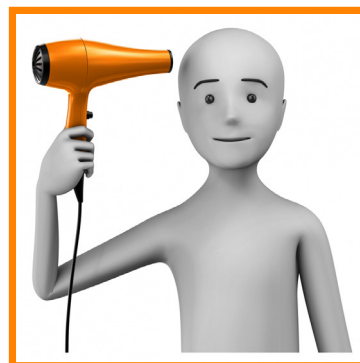
9. ME SECO EL PELO