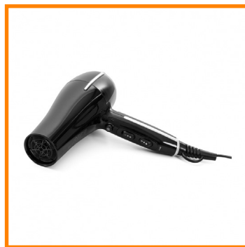
SECADOR DE PELO