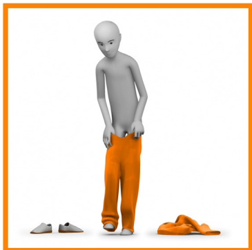
1. ME DESVISTO