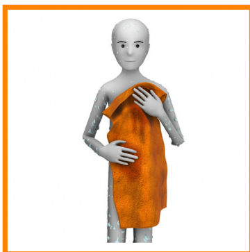
8. ME SECO EL CUERPO