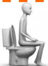
HACER CACA / PIS